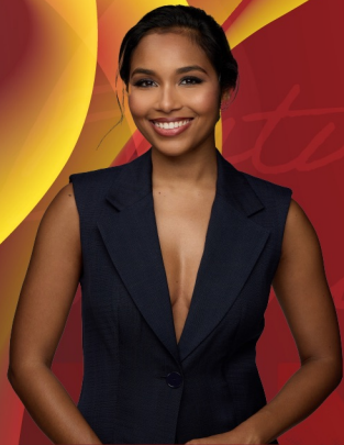
Clémence BOTINO Marraine du Festival MVAN 2026 Miss France 2020