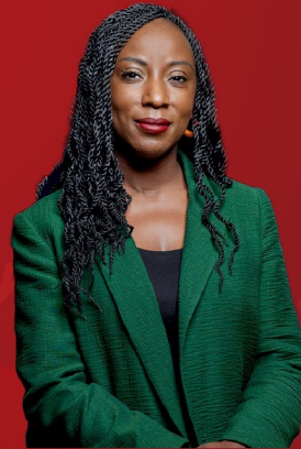
Aissata SECK Femme politique française militante pour la mémoire des tirailleurs sénégalais