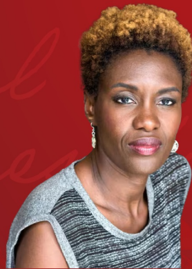
Rokhaya DIALLO Journaliste, militante féministe, éditorialiste et réalisatrice française